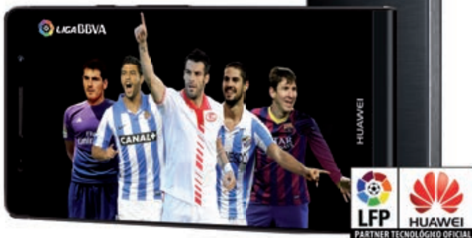
Huawei Ascend P6

Con Movistar ficha el Smartphone Oficial de la Liga BBVA por 12 €/mes* (+ IVA).